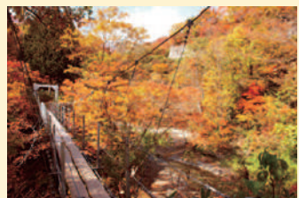
▲野川渓谷周辺(合地沢)