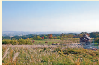
▲古代の丘 ススキ丘陵