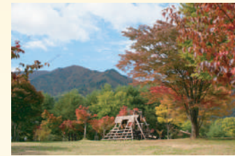
▲古代の丘/太陽の広場