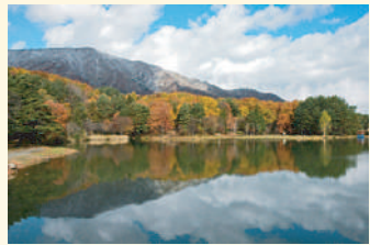
▲古代の丘/中里堤(なかざとつみ)