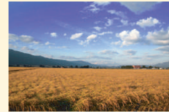
▲西根地区の田園風景