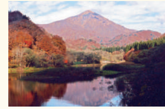
▲祝瓶山(いわいがめやま)