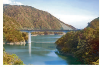
▲長井ダム・ながい百秋湖